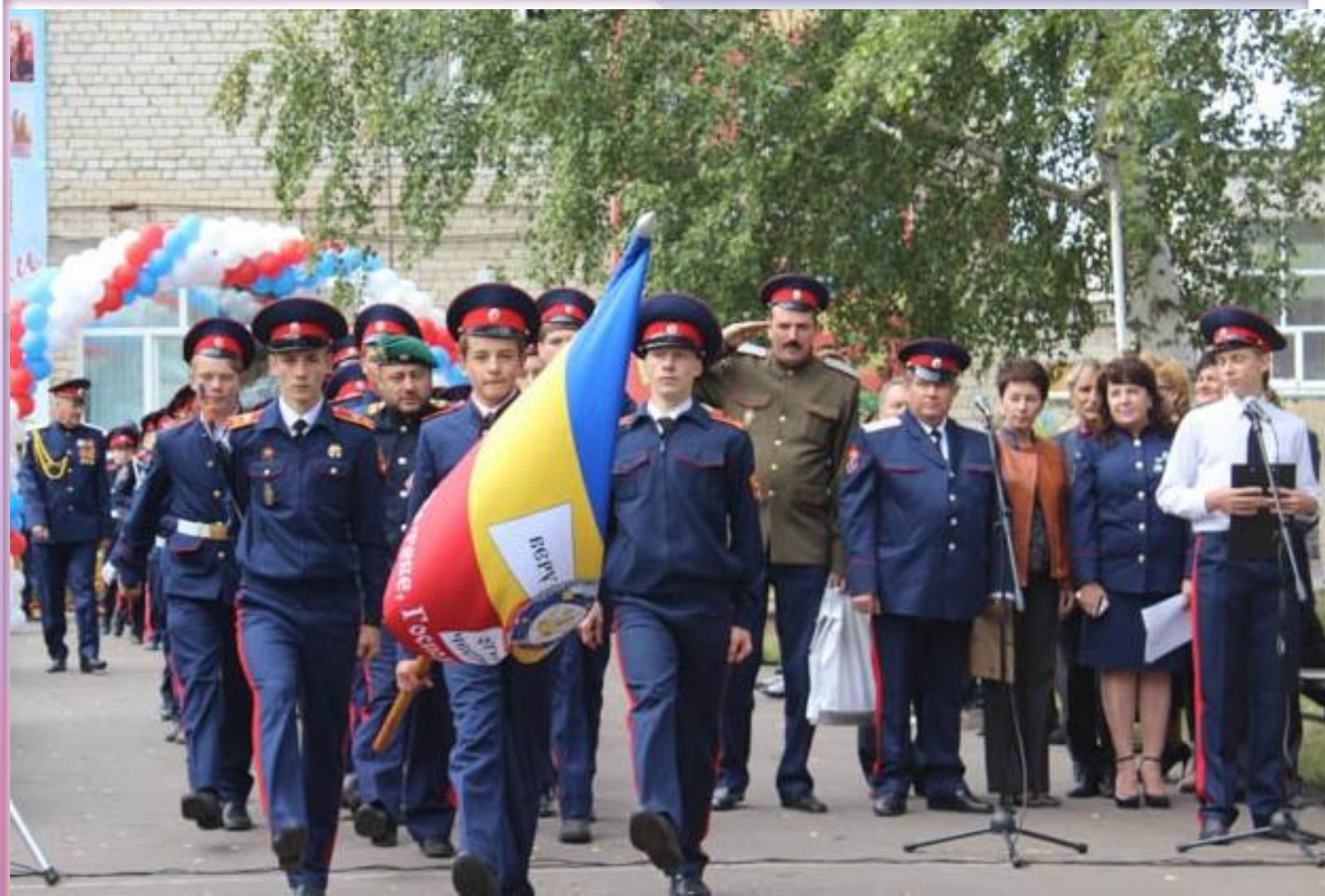
МОБУ СОШ п. Мичуринский Пензенского района